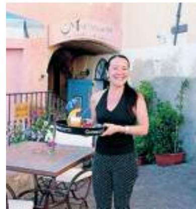
Cervò, il pub Mediterraneo