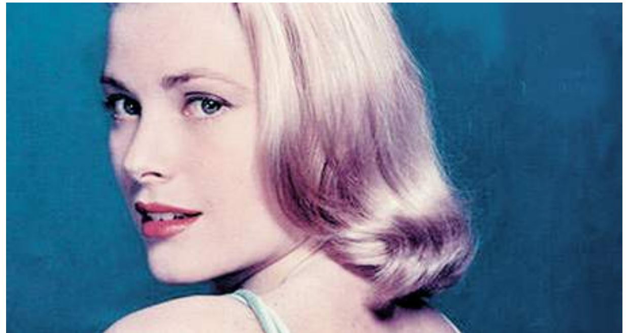
Il mito di Grace Kelly, splendida attrice e principessa, rivive al Grimaldi Forum

Saranno oltre quattromila i metri quadrati dedicati a Grace al Grimaldi Forum. La mostra ripercorre tutti i momenti e tutti gli aspetti della sua vita, dall'infanzia a Philadelphia alla carriera di star hollywoodiana, fino al ruolo di principessa monegasca impegnata quotidianamente a valorizzare l'immagine internazionale di un Principato che l'ha adottata e amata fin dalla sua prima apparizione sulla Rocca, nel 1956. La curatissima scenografia trasporterà il visitatore da una stanza all'altra, attraverso film, docu-